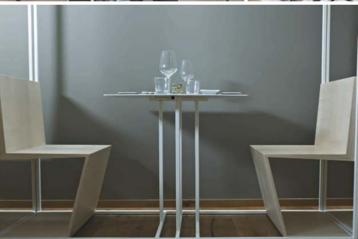
Particolari delle "bancarelle"; la pianta